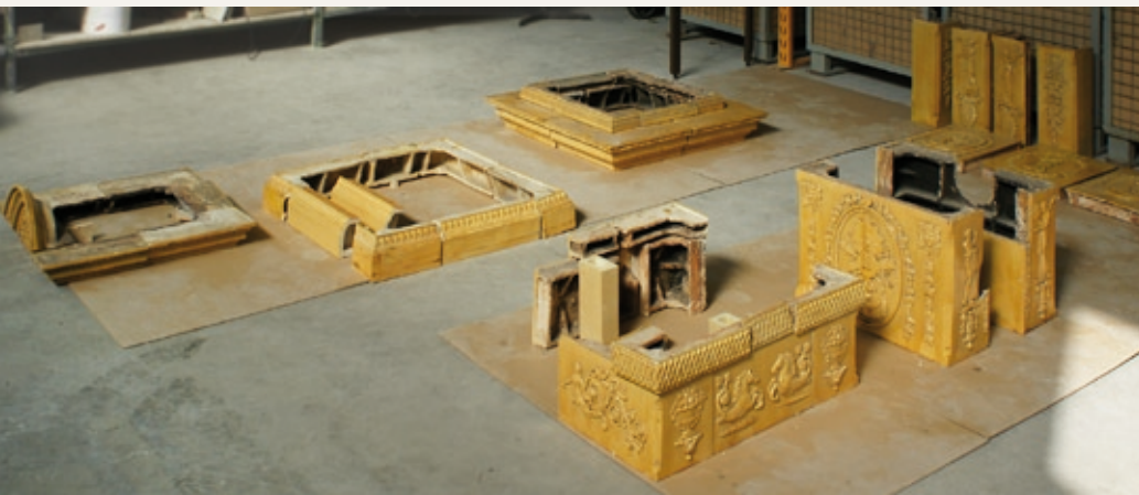
Gestaltung: artwork-mikk.de · © 2009